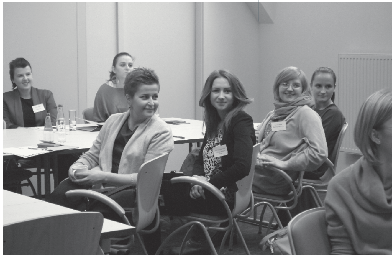
Drugi zjazd uczestników projektu, 12 lutego 2015 r.

Opracowywanie standardów zweryfikowało naszą dotychczasową wiedzę, tym samym dając impuls do doskonalenia działań grantodawczych.