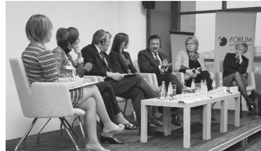
Seminarium pt. „Fundacja zaufania publicznego. Przejrzystość, legalizm i etyka działań”, 27 listopada 2014 r.

Fundacja BGK ma trzyosobowy Zarząd powołany przez fundatora na dwa lata. W jego skład wchodzi przedstawiciele fundatora – osoby kompetentne, posiadające doświadczenie odpowiednie do powierzonej funkcji i korespondujące z misją fundacji. Prezesem Zarządu jest osoba odpowiedzialna za departament komunikacji fundatora, mająca doświadczenie w dziedzinie społecznej odpowiedzialności biznesu oraz filantropii, a także w pracy w organizacji pozarządowej. Do reprezentowania fundacji upoważnionych jest dwóch członków Zarządu działających łącznie.