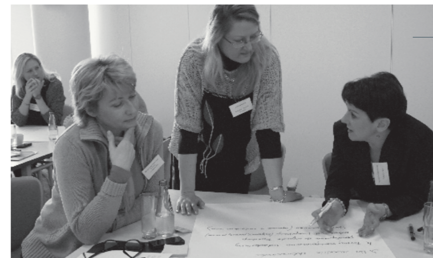
Warsztat pt. „Pracownicy i wolontariusze w fundacjach korporacyjnych”, 7 marca 2014 r.

— Kształtując swoje relacje z otoczeniem, fundacja powinna samodzielnie kontaktować się z interesariuszami. Korzystanie z pośredników typu agencja PR buduje niepotrzebne bariery oraz może powodować nieporozumienia. To fundacja wie najwięcej o swoich działaniach i najrzetelniej potrafi o nich informować. Kontakty bezpośrednie pomagają w budowaniu wiarygodności organizacji.