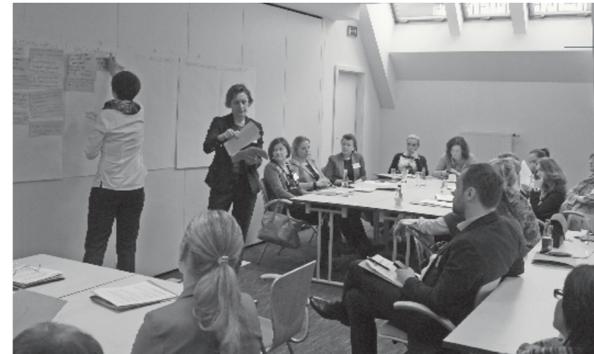
Drugi zjazd uczestników projektu, 13 lutego 2015 r.

Ewaluacja programu zaprojektowana została w odniesieniu do celu programu – było nim stworzenie samodzielnych (a więc z czasem niezależnych od fundacji) centrów aktywności oraz sieci współpracujących ze sobą lokalnych liderów,