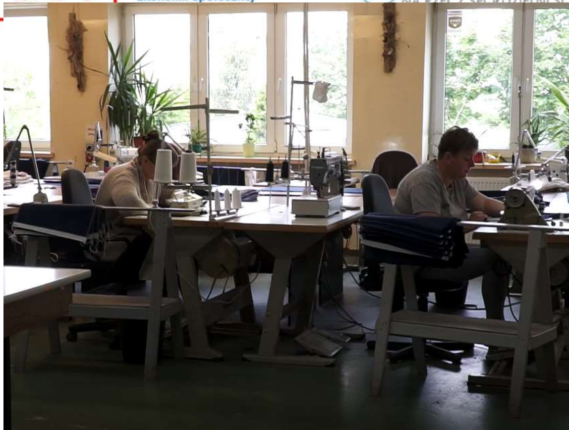
ŁUDZIE: pracowniczki Zakładu Aktywności Zawodowej w Słupcy szyją maseczki